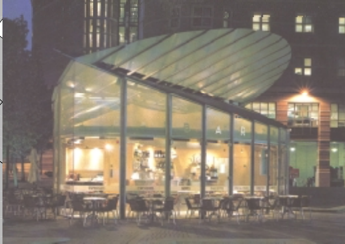
Beispiel für einen Pavillon als Café / Bar